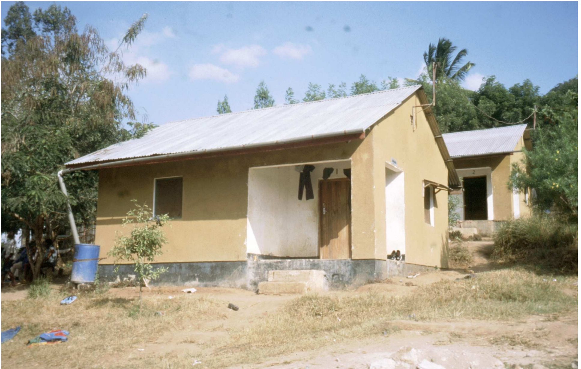
Unterkünfte der Jugendlichen